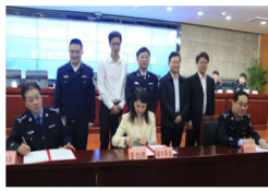
警企合作，蜗牛移动