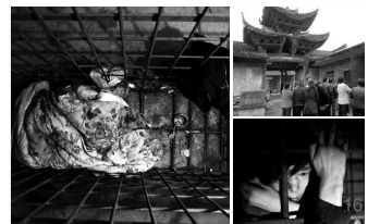
男子被空军录取兴奋过度发疯,铁笼里整整困了他9年的时光