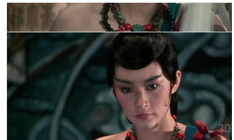
国外媒体最推崇的30部香港电影