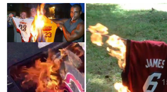
盘点那些年NBA球员被烧的球衣，詹姆斯三次上榜